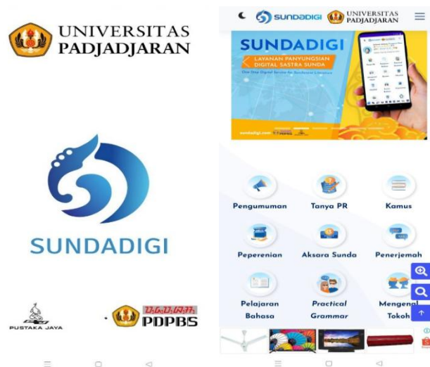
Gambar 1. Tampilan awal pada aplikasi SundaDigi.

Teknologi telah memainkan peran yang krusial sebagai media bantu dalam mengurai persoalan manajemen arsip. Dalam era digital, teknologi telah mengubah secara signifikan cara arsip disimpan, dikelola, dan diakses. Sistem manajemen arsip elektronik (Electronic Records Management System - ERMS) dan perangkat lunak manajemen dokumen telah memungkinkan organisasi untuk mengatur arsip secara lebih efisien. Dengan teknologi ini, arsip dapat dengan mudah diindeks, dicari, dan diakses secara cepat. Selain itu, teknologi juga memungkinkan penyimpanan arsip dalam format digital, yang mengurangi risiko kerusakan fisik dan mempermudah proses pemeliharaan. Keamanan informasi juga ditingkatkan melalui teknologi, dengan enkripsi dan otentikasi yang memastikan bahwa hanya pihak yang berwenang yang dapat mengakses arsip tersebut. Dengan teknologi, arsip dapat menjadi lebih mudah diakses secara daring oleh peneliti dan masyarakat, memungkinkan penelitian yang lebih mendalam dan pembelajaran yang lebih luas mengenai sejarah dan budaya. Dengan demikian, teknologi telah membantu secara signifikan dalam mengatasi persoalan manajemen arsip, memberikan efisiensi, keamanan, dan aksesibilitas yang lebih baik dalam mengelola warisan budaya dan dokumen bersejarah. Berikut merupakan tampilan awal pada aplikasi SundaDigi.